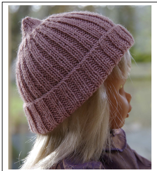
Avec revers 0-3 mois

Voici un petit bonnet pour bébé pour une toute petite fille.