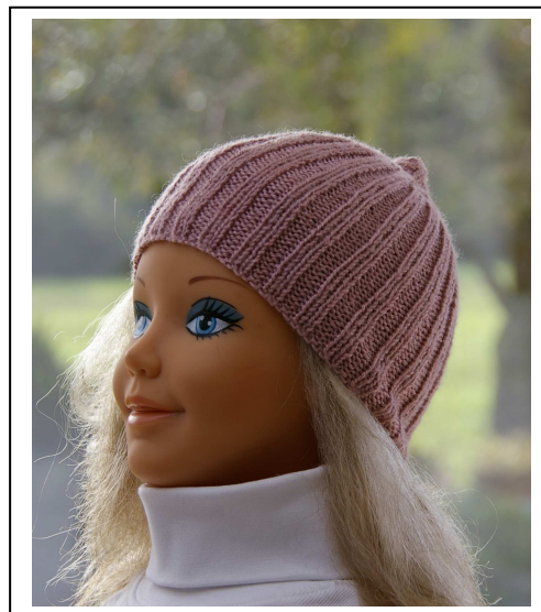
Sans revers 3-6 mois et au-delà